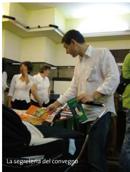
La segreteria del convegno

1 → che non avevamo previsto. Ho detto "storia"; ma la parola è riduttiva, il termine più esatto è compagnia, la storia di una compagnia che, in questi venticinque anni, è cresciuta, si è fatta più consapevole, attenta alle sfide del tempo, capace di operatività e di impegno; una compagnia che è stata sostegno e paragone per tante famiglie, perché in fondo, in ultima sostanza, quello che ci sta a cuore sono le persone, con il loro insopprimibile desiderio di bene e di felicità, la loro libertà, la fatica e la sofferenza che a volte segnano la loro quotidianità". Ed è per questo il convegno si è presentato come uno "spunto positivo, di rilancio, per l'impegno quotidiano