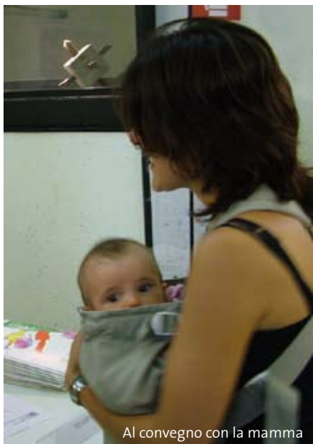
Al convegno con la mamma

M. G. Lepori - Sorpresi dalla gratuità, Cantagalli ( www.edizionicantagalli.com ), Siena, 2007, pagg. 110, euro 10.