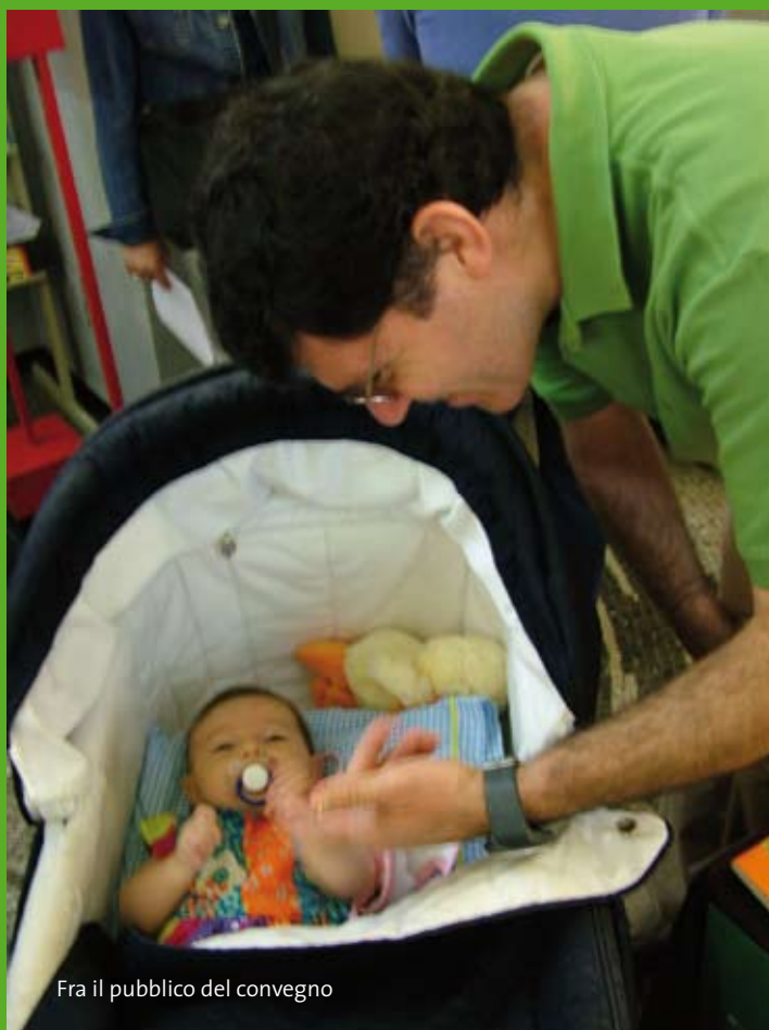
Fra il pubblico del convegno

compagnia c'era, per noi, l'abbraccio di Cristo: un dono, una grazia.