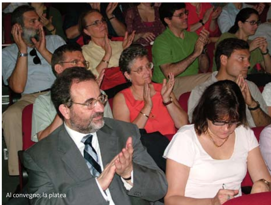
Al convegno: la platea

“La nostra è una storia di storie, tutte segnate dalla quotidianità e dalla normalità della vita della famiglia – lo ha ribadito Mazzi nel suo intervento – alcune clamorose come adottare un bambino con handicap e accompagnarlo per tutta la vita, oppure prendere in casa una ragazza madre con tutti i suoi problemi, o un adolescente di difficoltà, altre assolutamente semplici, come dare un pasto e far fare i compiti al compagno di scuola dei propri figli, o aiutare una