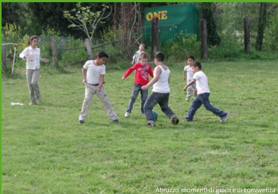
Abruzzo, momenti di gioco e di convivenza