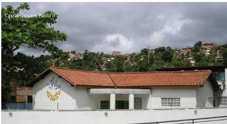
L'asilò Giovanni Paolo II

spettata che emerge nelle tre testimonianze proposte, che ci commuovono e lasciano trasparire il miracolo: “una presenza che cammina con noi” come dice don Giussani.