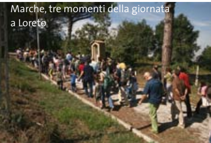
Marche, tre momenti della giornata a Loreto