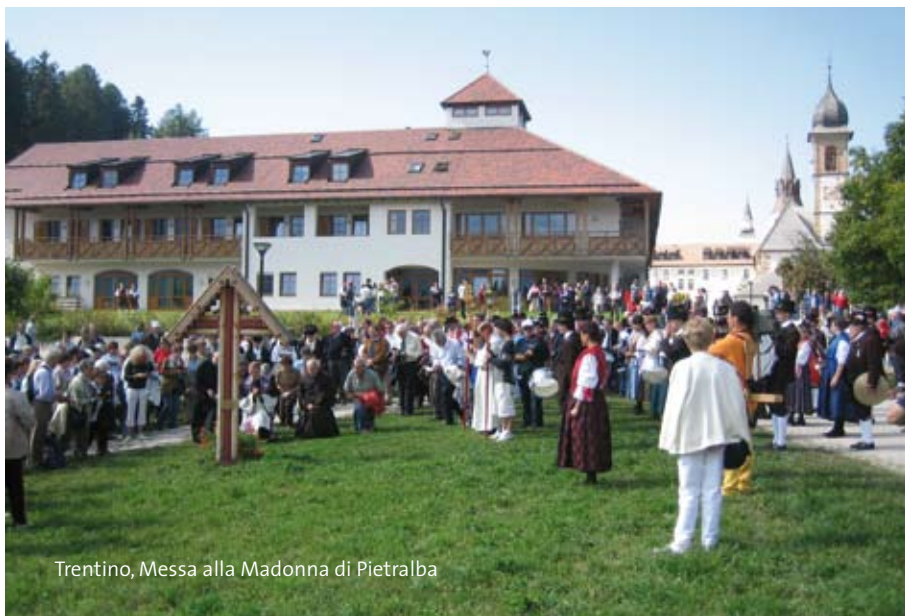
Trentino, Messa alla Madonna di Pietralba