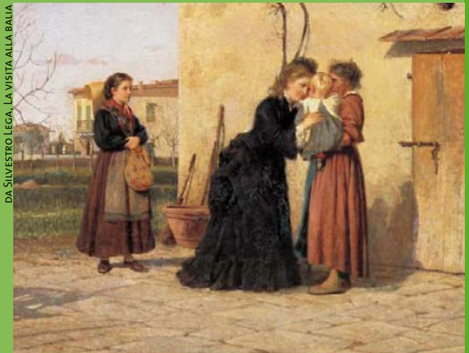
DA SILVESTRO LEGA, LA VISTA ALLA BALLIA