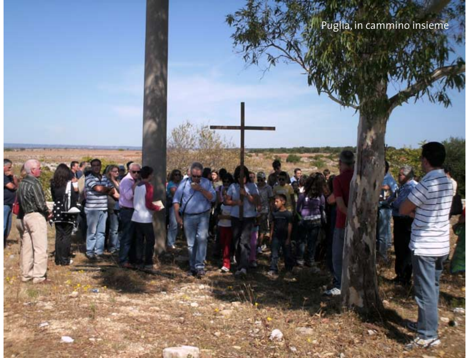
Puglia, in cammino insieme