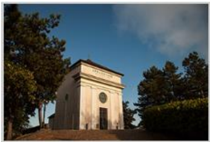
Cappella Prima Apparizione

Per coloro che non riescono a fare il percorso a piedi l'appuntamento è alle 11.30 presso la Cappella della Prima Apparizione